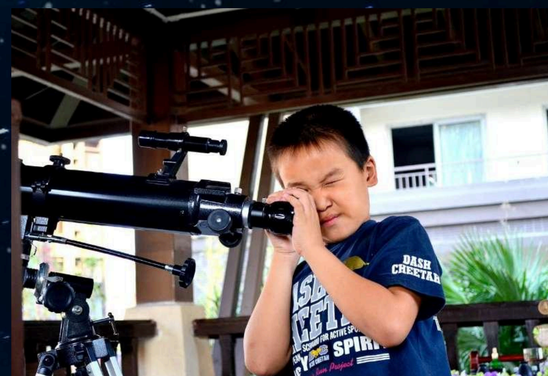
「星間の星を見よう！」