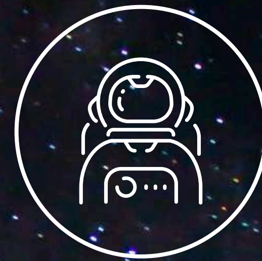
天文台のスタッフのこと