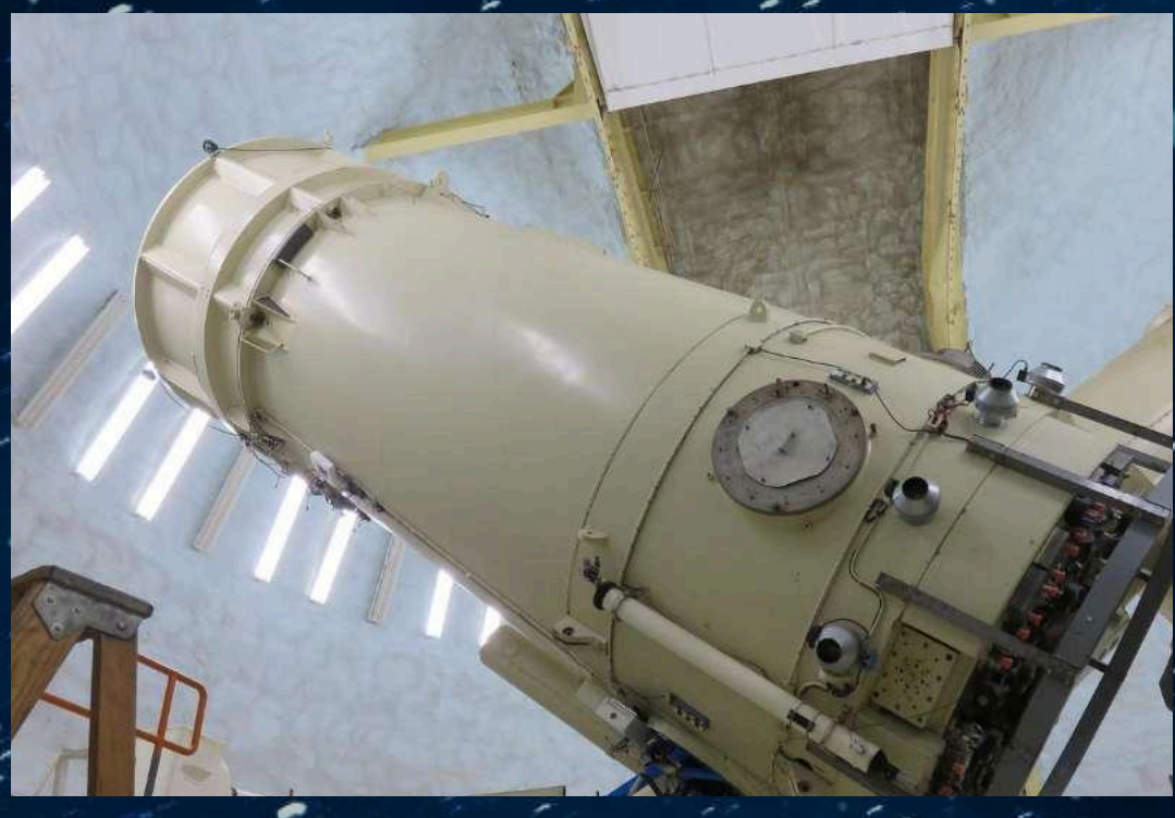
11月の公開日カレンダー