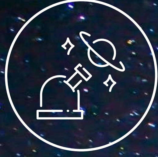
すながわ天文台の望遠鏡のこと

すながわ天文台は、2000年に地域の有志によって設置された天文台です。 2018年に運営資金や人材不足により一時閉館となりましたが、 市民の声を受けて2020年に砂川市に譲渡され、 運営と維持管理を砂川市が行うこととなりました。 市民が残した天文台は、 小さな町で今日も星空を見上げています。