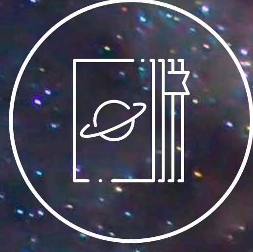
すながわ天文台のあゆみ