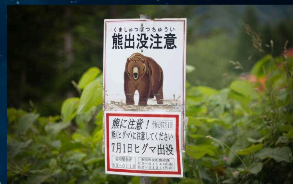
熊の目撃情報について