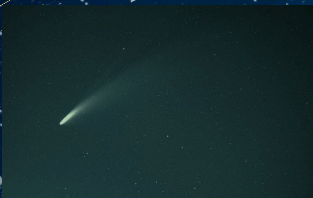
レモン彗星の撮影に成功しました