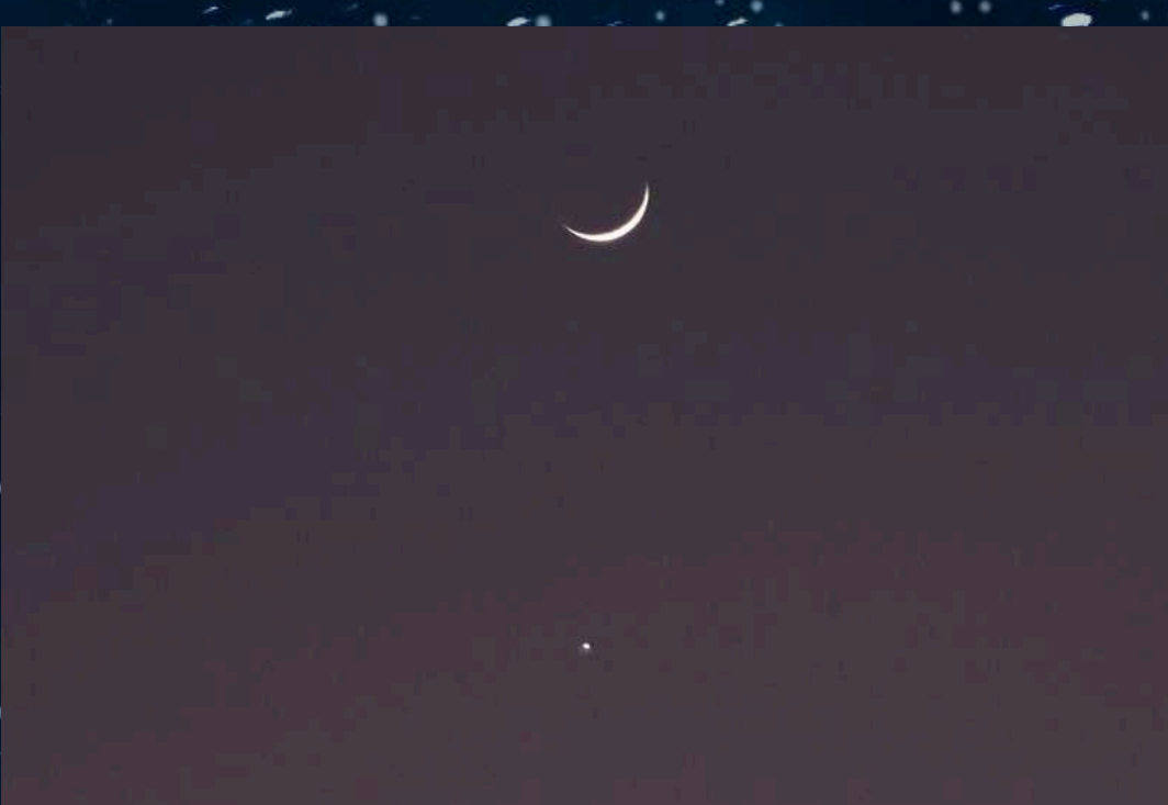
天文台で朝活！明けの明星をみよう！