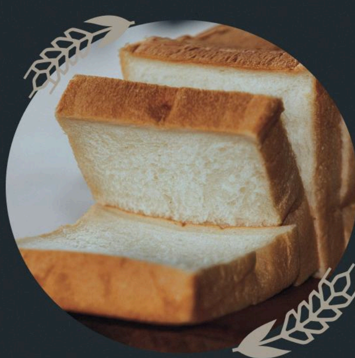
食パン White Bread

ふんわり香る小麦の風味、コクのあるバター豊かな味わい。 北海道の素材を使って丁寧に焼き上げたパンをご用意しています。 毎日食べるものだから、飽きのこない素材なおいしさと、 体にやさしい素材選びを大切にしました。